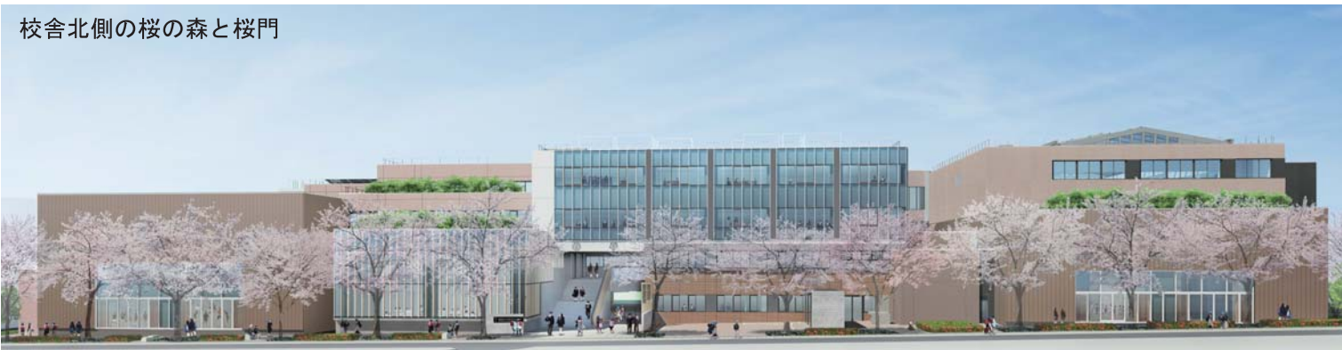
校舎北側の桜の森と桜門